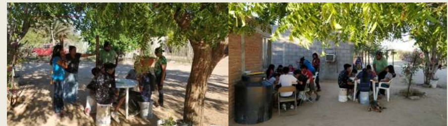
Jóvenes dibujando bajo la supervisión de personas mayores