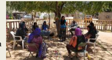
Hamoii, el juego del círculo